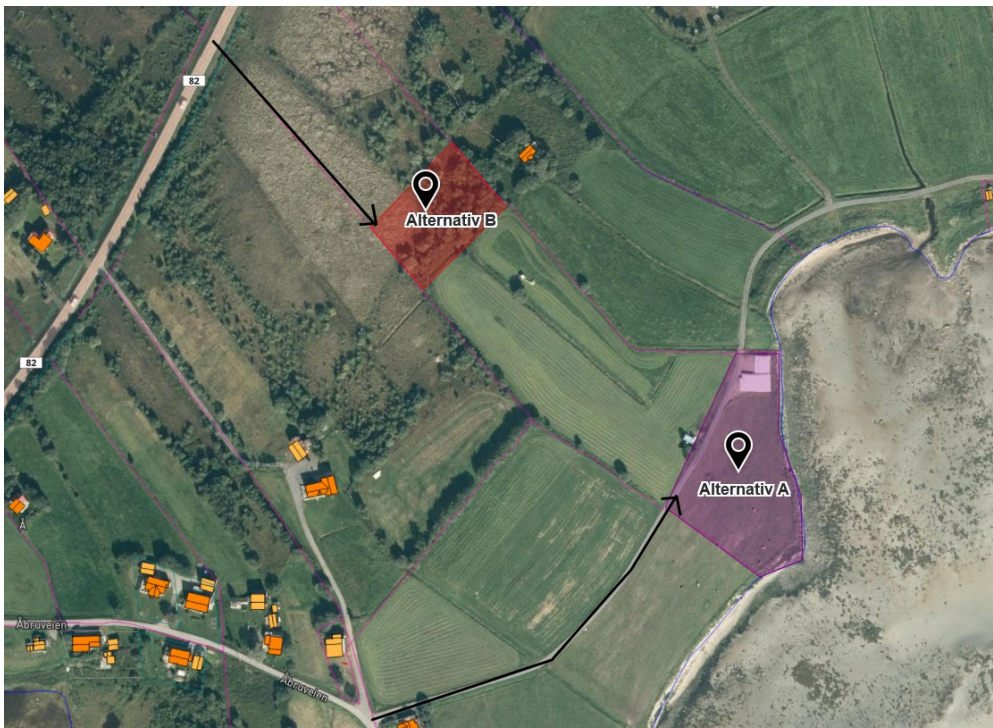
Ortofoto fra kommunekart.com med påtegninger.

Alternativ B ligger ovenfor dyrka mark, i et areal med myrgrunn og med småskog (lauv).